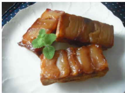
キャラメルリンゴ

チョコクランチ 2,500円 (定員6人) ※キッズ教室 対象=3歳～小学6年生まで 2/9 (日) 13時～