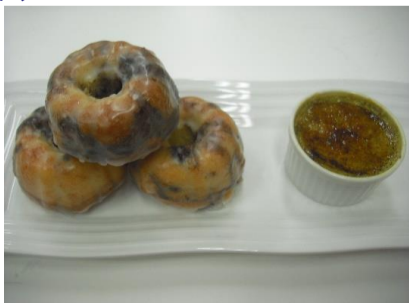
ゆずココアクグロフ 抹茶ブリュレ