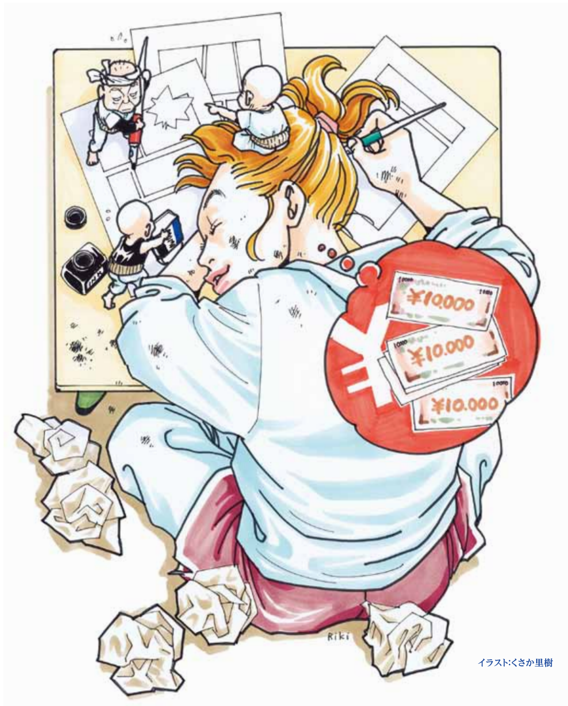
イラスト:くさか里樹